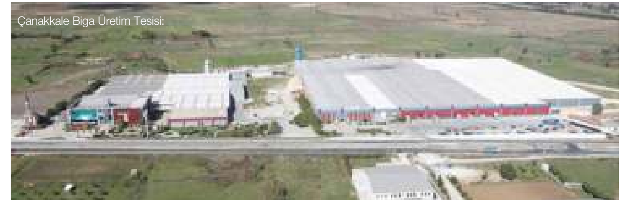
Çanakkale Biga Üretim Tesisi: