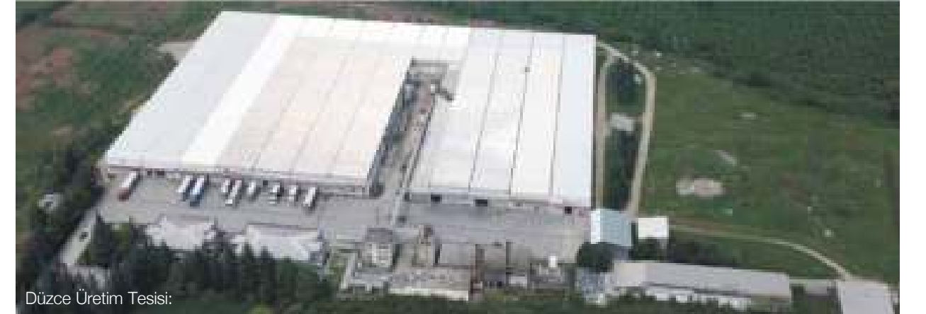
Düzce Üretim Tesisi: